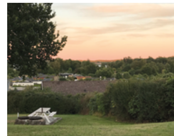
Sommeraften på Kroen

Vores plan er at begynde KROENS FÆLLESSPISNING lige så snart det er forsvarligt med hensyn til Corona-smitten.