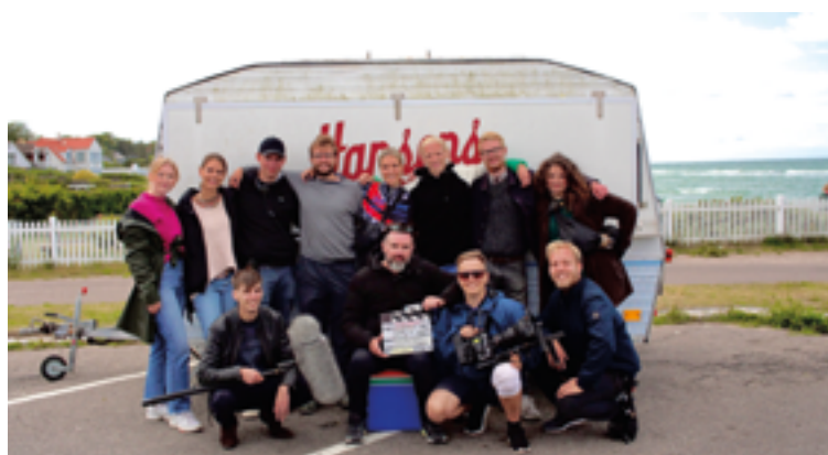
Optagelse fra Gilleleje – Veststrand