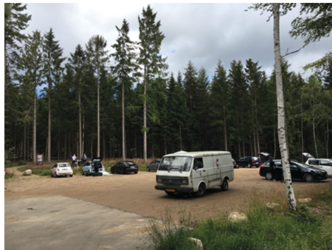
Filmoptagelse i Gribskov