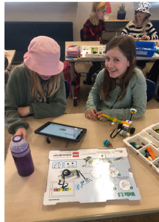
Eleverne er i gang med at programmere deres legorobotter

I foråret har alle årgange været igennem et robottema, hvor de bl.a. har arbejdet med programmering. Projektet er sket i et samarbejde med PLC(skolebiblioteket) på Hillerødsholmskolen, og viser, at det