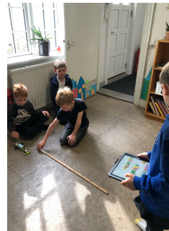
Afprøvning af robotter