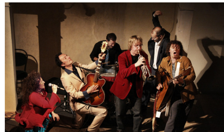
Klezmafobia spiller fredag 3. marts 2023.

en reduceret pris for medlemmer. Som medlem kan man som alternativ få 20% rabat på køb af løssalgsbilletter til eget brug. Men de skal købes i forsalg senest en uge før arrangementets start, for at man kan få rabatten.