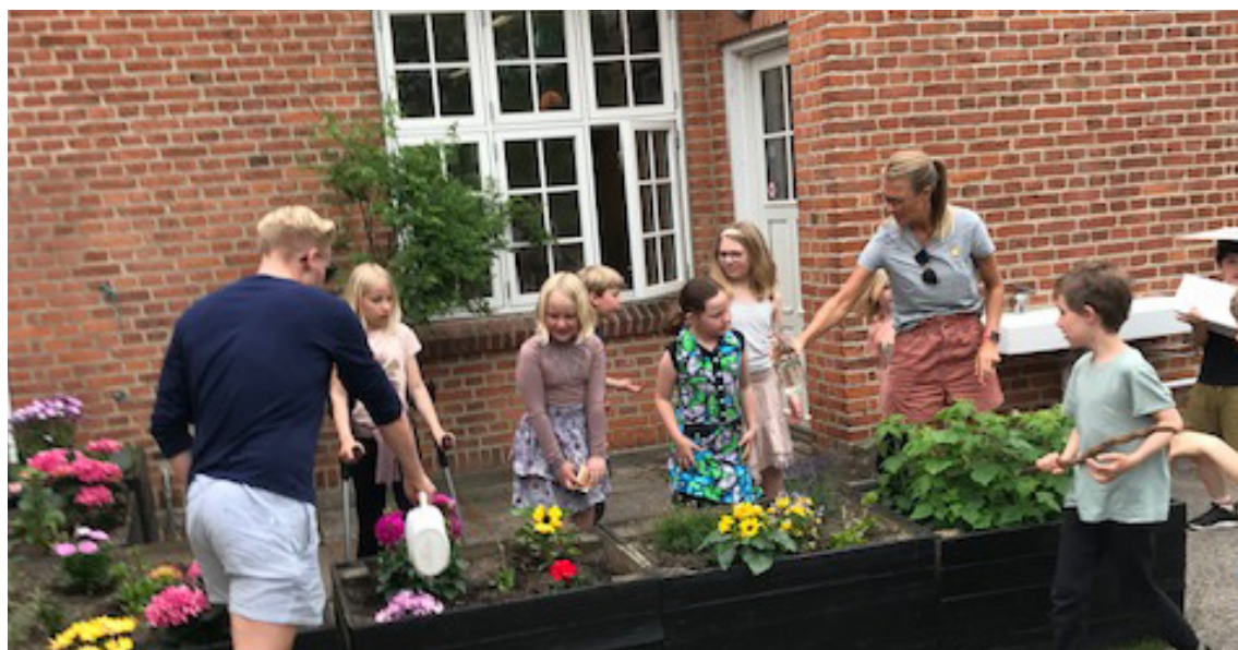
Elever og lærere vander blomsterne som forældrene har sørget for forskønner skolegården

er en stor styrke for et lille sted som Gadevang at være tilknyttet en stor skole med alle de ressourcer, de her kan trække på.