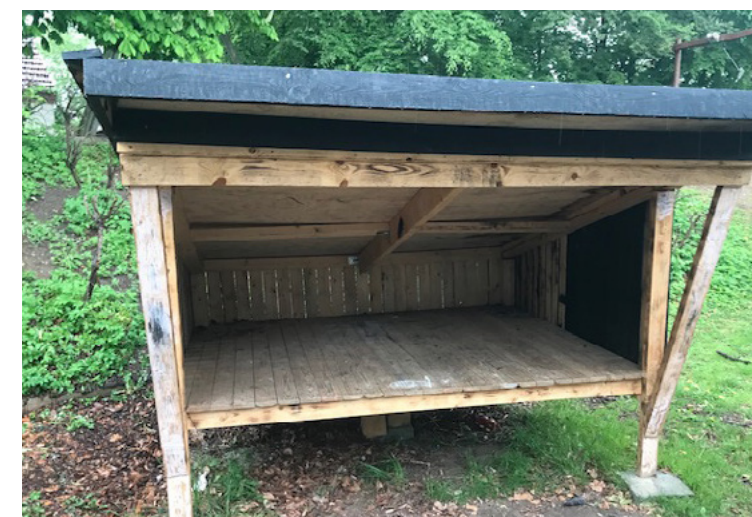
Shelter bygget i et samarbejde af eleverne i et samarbejde mellem Erhvervsskolen, Gadevang og Asyl og skolen i Gadevang