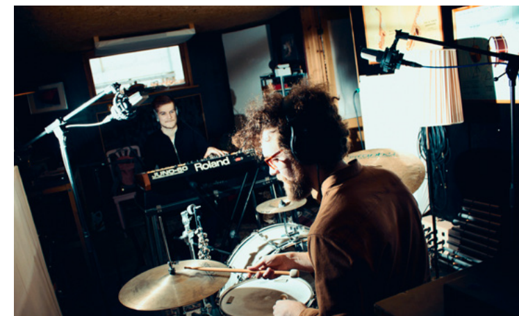
Jazz duoen Svaneborg Kardyb spiller live på Kroen 29. januar 2023.

Oplevelser på Kroen er billige i forhold til, hvad man skal betale for det samme andre steder. Og så er der oven i købet rabat at hente, hvis man er medlem af støtteforeningen Forsamlingshusets Venner. Medlemmer kan købe et årskort for kun 800 kr., som giver adgang til 24